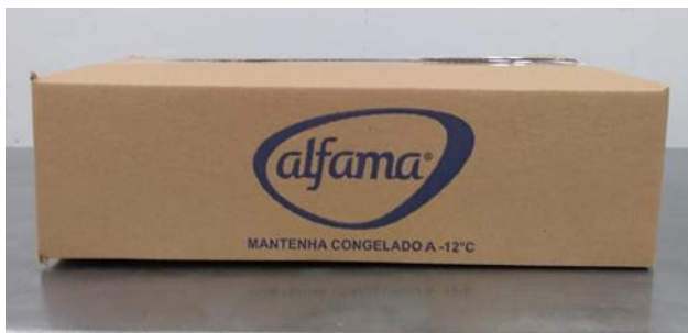
FOTO ETIQUETA ADESIVA / CAIXA

alfama HAMBURGUER DE CARNE BOVINA CÓDIGO: PA00420