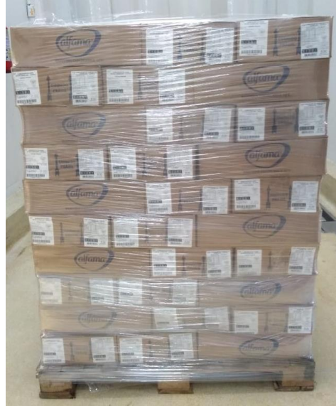
FOTO DO PALLET