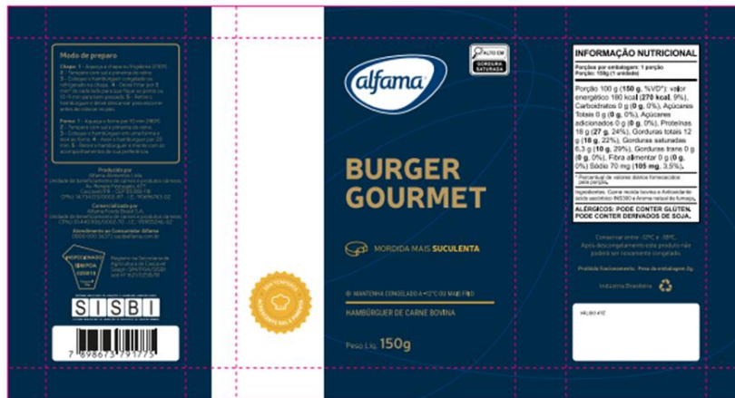
FOTO DO PRODUTO EMBALADO